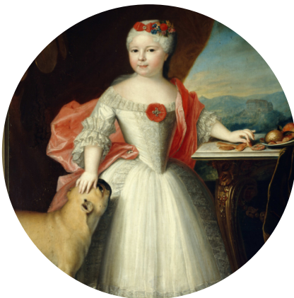
Porträt der jungen Gräfin Sophie Christiane Charlotte Erdmüthe zu Erbach, Saarlandmuseum – Alte Sammlung

→ Hinweis: Aufgrund von Brandschutzbestimmung dürfen sich maximal 15 Personen gleichzeitig in den Räumen der Alten Sammlung aufhalten